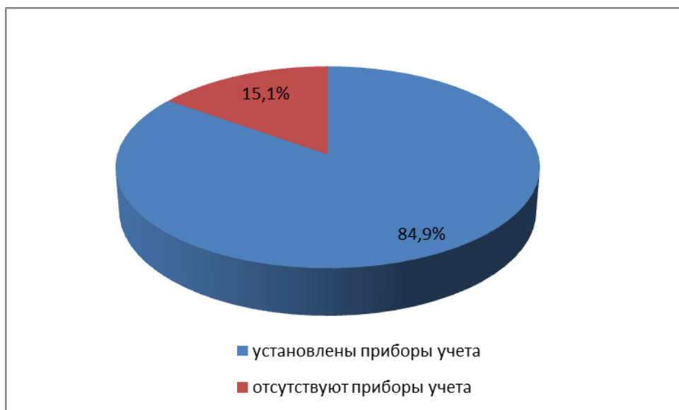
Рисунок 3.3. Оценка оснащенности приборами учета в Подрезчихинском сельском поселении

За 2013 год доля потребителей воды с установленными приборами учета составляла 84,9% (рисунок 3.3).